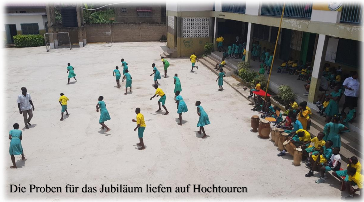
Die Proben für das Jubiläum liefen auf Hochtouren

Auch ein ganz neuer Trikotsatz vom SV – Wacker Burghausen für die Fußballbegeisterten an der Schule konnte mitgenommen werden.